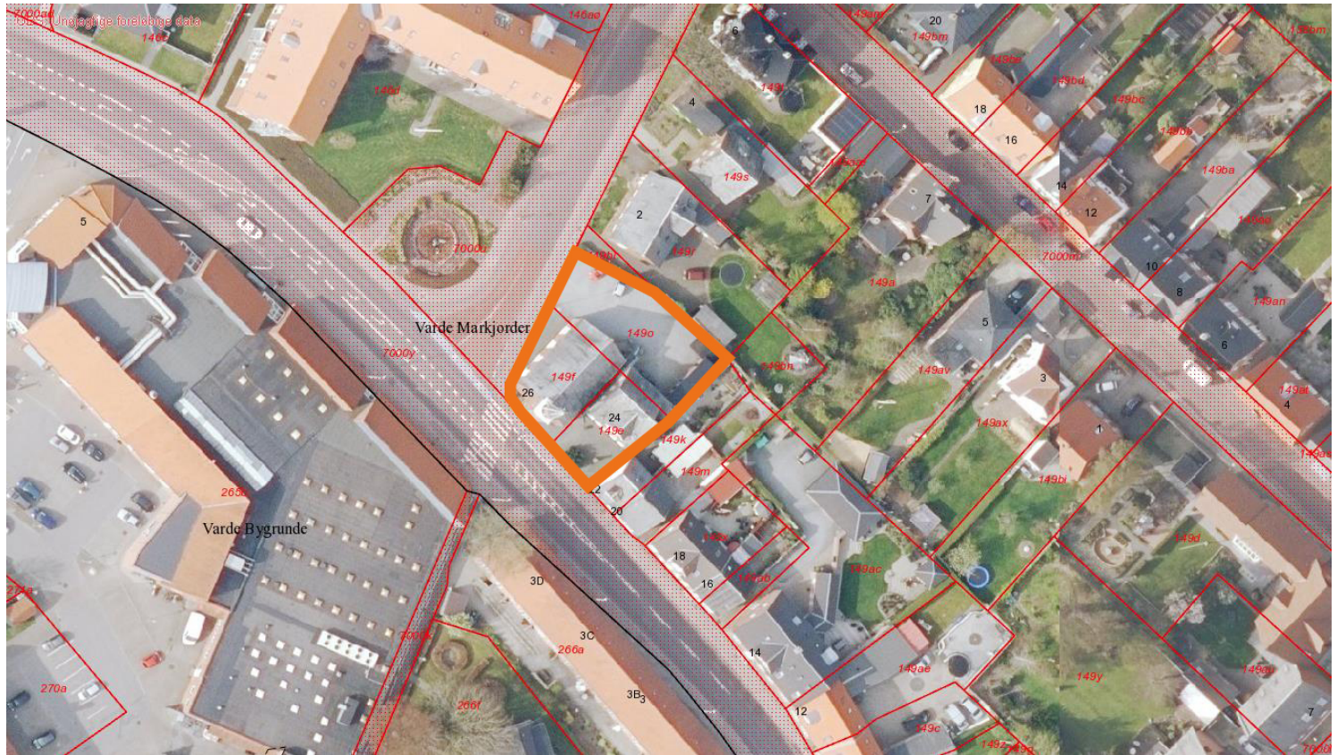
Matrikelafgrænsning for området